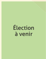
Circonscription 22 Charlesbourg